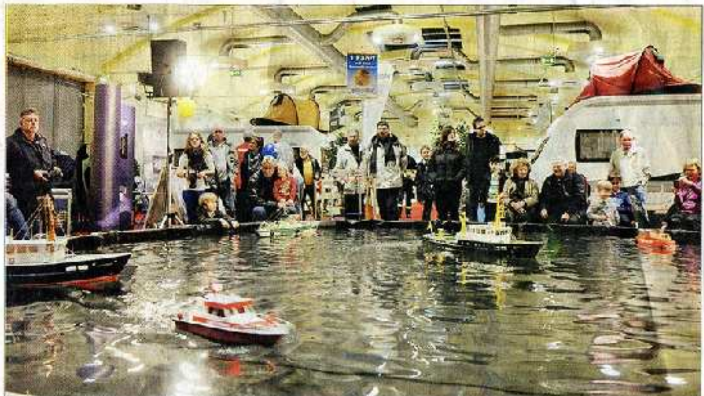
Schiffahrt im Kleinen: In einem großen Pool präsentierte der Oldenburger Schiffs-Modellbau-Club die Möglichkeiten, Kapitän zumindest eines Modellschiffes zu werden.

MESSE Caravan - Freizeit - Reisen hat Stammassteller und ein festes Publikum