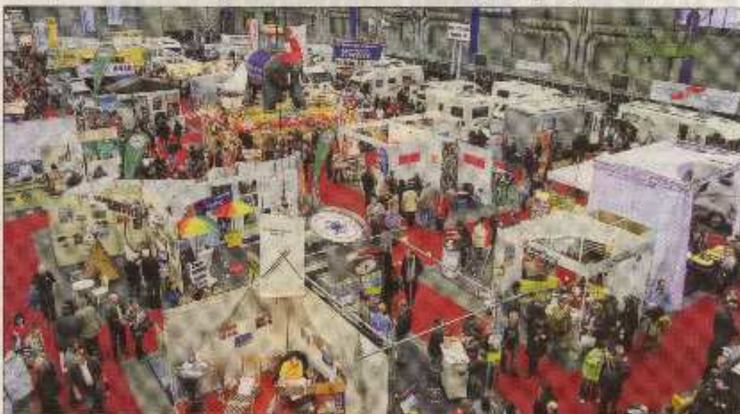
Am Wochenende dreht sich in der Weser-Ems Halle alles um Caravan, Freizeit und Reisen.

Die 35. Caravan Freizeit Reisen hat von Freitag bis Sonntag, 20. bis 22. Januar, jeweils von 10 bis 18 Uhr geöffnet. Am ersten Tag gelten für Besucher ab 60 Jahren vergünstigte Eintrittspreise.