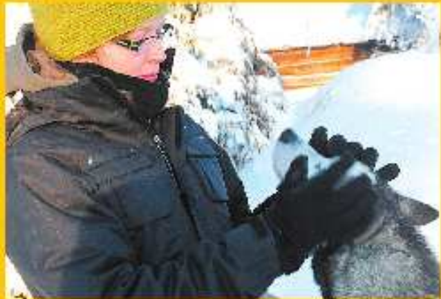
Huskys zum Anfassen

Der zweite Oldenburger Skandinavientag findet im Rahmen der Messe Caravan-Freizeit-Reisen (CFR) am 21. Januar 2012 in der Weser-Ems-Halle statt. Verbinden Sie den Besuch der CFR mit einem Besuch dieser Sonderausstellung im Großen Foyer.