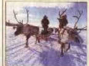
Urlaubs-Spaß in Skandinavien: eine Rentiersafari in Lappland.

Skandinavientag: An diesem Sonnabend findet im Rahmen der Messe im großen Foyer außerdem der 2. Oldenburger Skandinavientag statt – mit zehn Veranstaltern, Huskys und Vorträgen (z.B. 11 Uhr Postschiffreisen, 12 Uhr Island, 13 Uhr Seekajak-touren, 14 Uhr Postschiffreisen, 15 Uhr Finnland, 16 Uhr Ferienhaus in Dänemark und 16.30 Uhr Norwegen-Fähren). Um 19 Uhr beginnt eine Dia Multivision über Island im Kleinen Festsaal.