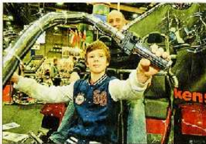
Fahrtwind im Gesicht: Neben Caravans und Busreisen dürfen Motorräder und Trikes nicht fehlen.