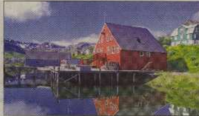
Die besondere Farbenpracht im kurzen Polarsommer ist malefisch und facettenreich.

OLDENBURG. Reisen nach Skandinavien - erfrischend anders! Das ist das Motto der 16 Veranstalter, die sich oder ihre Kataloge im Rahmen des 2. Oldenburger Skandinavientages präsentieren. Abgerundet wird der Skandinavientag mit einer Dia-Multivision „Island - Zauber des Nordens“ von Reinhard Pantke. Der Globetrotter berichtet über dampfende Geysire und schmatzende Schlammquellen, bizarre Eisberge und Höhlen. Wilde Fjordlandschaften mit riesigen Vogelkolonien, öde Hochlandwüsten und die in den kurzen Polarsommern im ständigen Tageslicht „explodierende“ Farbenpracht der isländischen Natur sind einige