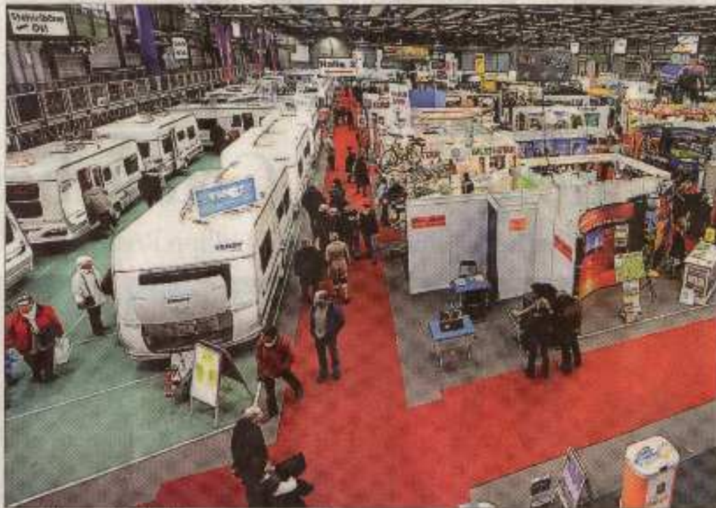
Große Auswahl: Wie in den vergangenen Jahren werden auch diesmal wieder Wohn- und Reisemobile in der Weser-Ems-Halle zu sehen sein.

Weniger als 20 Prozent der Aussteller sind laut dem Bereich